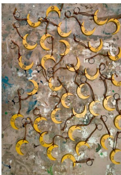
“portachiavi di luna”, piccola falegnameria del Centro Asso

Il duplice obiettivo è abitare il Centro in sicurezza e nel contempo con la massima naturalezza oggi possibile: ciò ha comportato una redistribuzione degli utenti all'interno dei diversi laboratori, finalizzata a garantire le migliori condizioni nell'attività quotidiana dal punto di vista della salubrità.